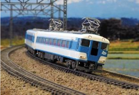
近畿日本鉄道(株)商品化許諾済

15200系あおぞらⅡは、18200系あおぞらⅡの後継車両として12200系スナックカーを改造して登場しました。先代あおぞらⅡに準じた白い車体にスカイブルーのラインが入った塗装に、車体各所にロゴマークがレタリングされています。改造に際して前面ヘッドマーク及び側面行先方向幕が撤去されているのが特徴で、前面貫通扉部分は黒色で塗装されています。15202編成は先頭車と中間車で搭載されているパンタグラフが異なります。15201編成と15202編成は、2014年に引退しました。