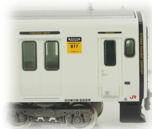
▲車両前頭部. 各種ロゴを精密印刷