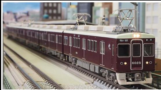
阪急電鉄商品化許諾済

6000系は神戸線、宝塚線用として、5100系の電装品に2200系の車体を組み合わせている系列で、1976年(昭和51年)から1980年(昭和55年)にかけて126両が製造され、1985年(昭和60年)に4両が追加製造されました。登場当時は他の阪急通勤車と同じくマルーン一色でしたが、現在では車体上部にアイボリー塗装を施した新塗装になっています。数多くの編成バリエーションがあり、神戸線・宝塚線では主に8両編成が運用されていますが、今津北線では3+3両の6両編成が、今津南線・甲陽線では3両編成が活躍をしています。