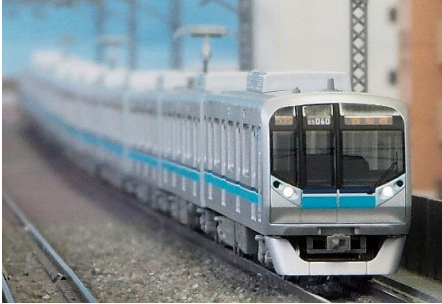
東京地下鉄株式会社商品化許諾申請中

東京メトロ発足後の2004年度に製造された05系13次車は東葉高速鉄道2000系と共通設計の日立製作所製「A-train」構体を採用しており、後に登場した有楽町線・副都心線用の10000系のベースになっています。従来の05系と比較して張り上げ屋根構造になっている点、車端部が三角型の断面構造となっている点が外観上の特徴です。13次車は第40～43編成の4編成で、他の05系共通運用で活躍中です。