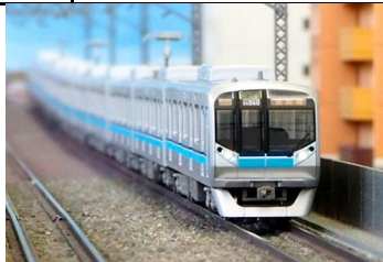
写真は前回製品です。