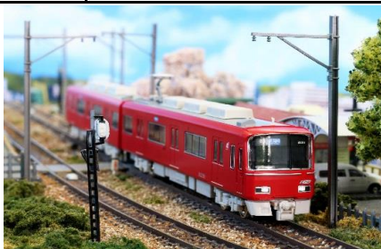
写真は前回製品です。