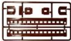
茶色成型イメージ(ボディ他)